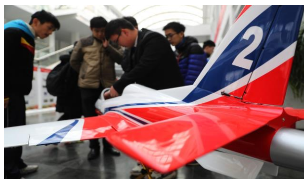
大学生在给观众展示飞行平台快速滑行。